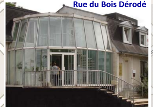
Rue du Bois Dérodé